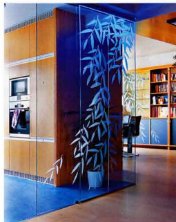
JEDINEČNÝ A NEOPAKOVATELNÝ VÝRAZ

JEDINEČNÝ A NEOPAKOVATELNÝ výraz dodává interiéru skleněná posuvná stěna nazvaná Palmový list z Ateliéru Zampach. Plochy skla jsou upraveny pískováním a stříkaním šedou barvou, nasazení LED zdroji umožňují vizuální efekt instalace. GALERIE KINCŮVA, www.galeriekincova.cz