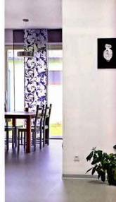
UNIKÁTNÍ SKLENĚNÁ PLASTIKA