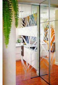
DO DETAILU PROMYSLENÁ ÚPRAVA