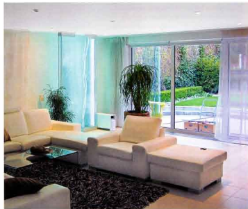
ILUZE TEKOUCÍ VODY