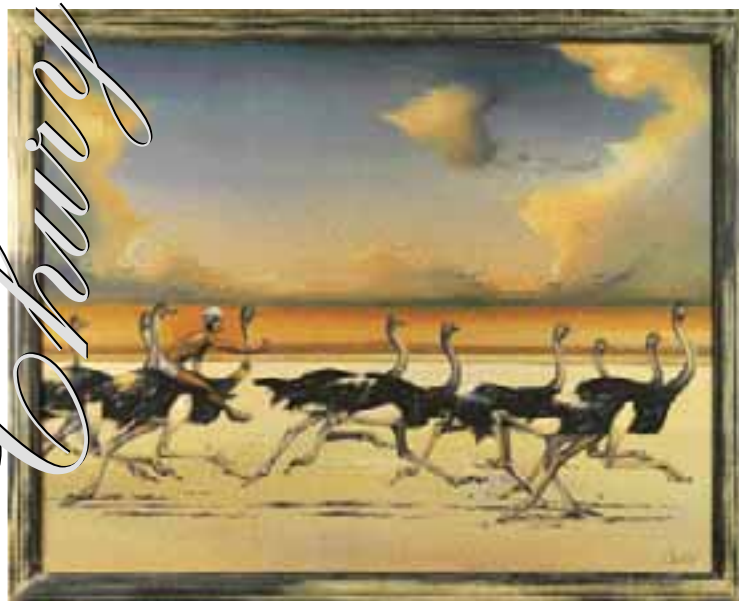
HARLEY-DAVIDSON, olej na plátně 75 x 85 cm