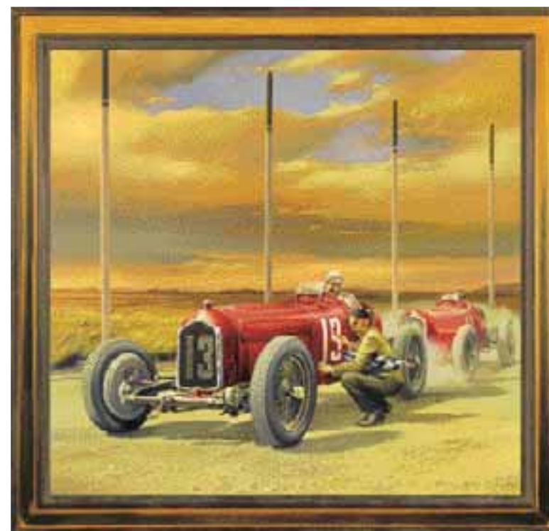
PÁTEK 13., olej na plátně 80 x 90 cm