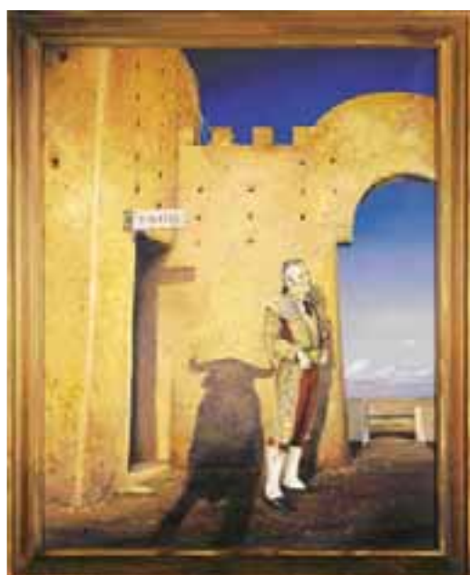
TOILETTE, olej na plátně 75 x 90 cm