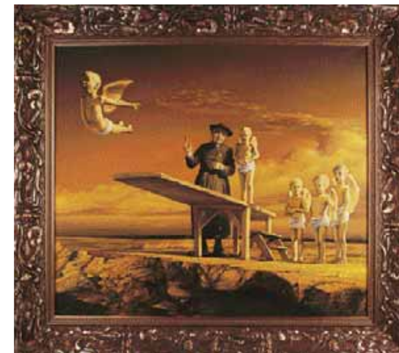
ŠKOLA V PŘÍRODĚ, olej na plátně 65 x 75 cm