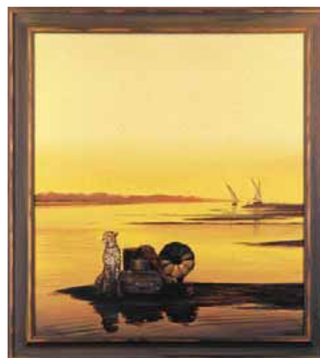
POSLEDNÍ SPOJ, olej na plátně, 80 x 90 cm

TEXT: Jitřiška Kodíčková Cena obrazů 90-120 000 Kč