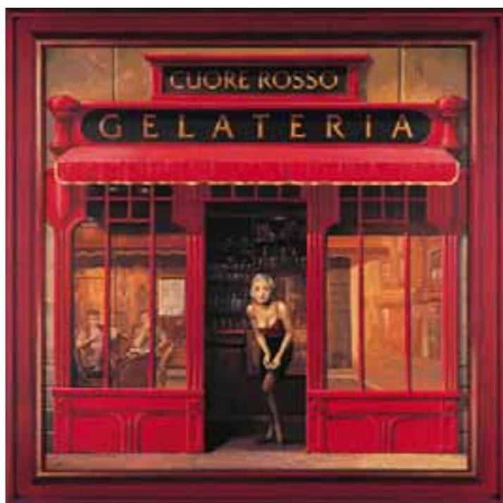
GELATERIA, olej na plátně 80 x 80 cm