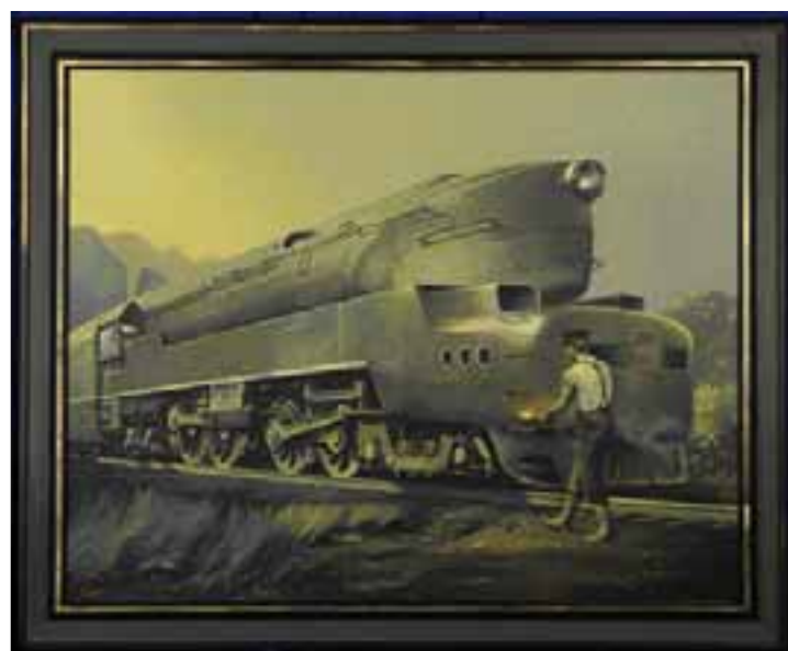
KYKLOP, olej na plátně 80 x 90 cm